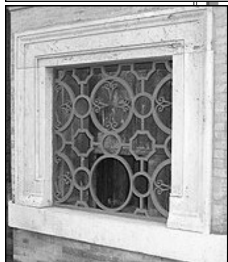
Historické okénko pro nalezence v nemocnici svatého Ducha v Římě (Sassia).