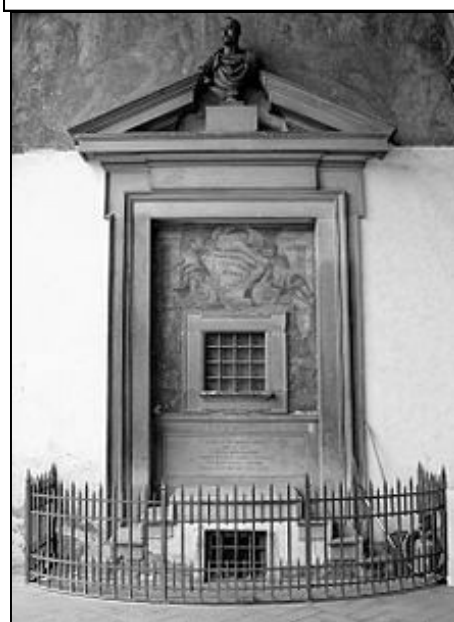
Okénko renesančního babyboxu Ospedale degli Innocenti ve Florencii