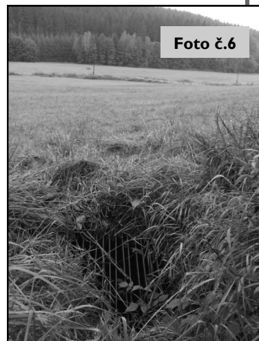
Foto č. 6