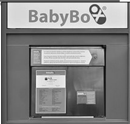
Venkovní strana českého babyboxu nové generace.

„Náš program je jasný a zřetelný. Máme jediné přání. Aby již nikdy nebylo nalezeno mrtvé tělíčko!“