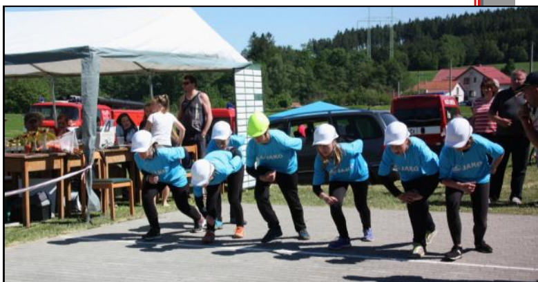
Mladí hasiči z Borů sklízí první pohárové úspěchy. Gratulujeme!