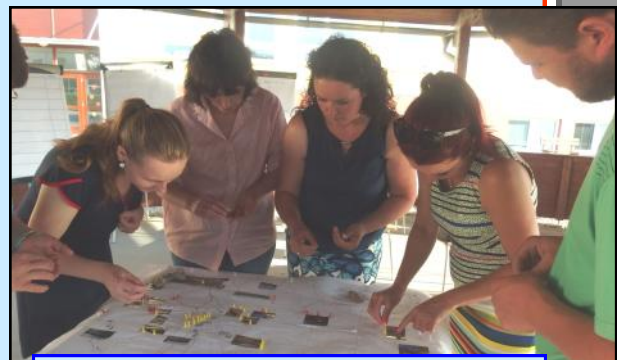
Novinkou letošního fóra byla tvorba pocitové mapy.

Jistě, nestačí jen problémy najít a pojmenovat. Nutné je hlavně je vyřešit. Když se podíváte na stránku 2, kde je z jednání ZO 26.5.2017 rekapitulace minulých 10 P je vidět, že se věci řeší.