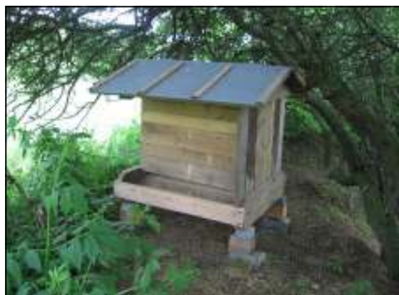
Samokrmítko pro srnčí zvěř