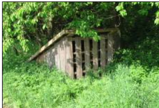
Zásyp pro bažanty