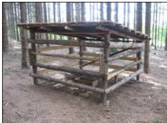
Krmné zařízení pro zajíce