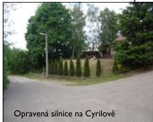
Opravená silnice na Cyrilově

Kompostárna, která by měla vzniknout v prostorách podniku Zemas v Dolních Borech je na tom podobně, výzva k podání žádosti o dotace z OPŽP bude v září 2008.