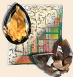
NOVÁ VÝSTAVA POKLADNICE DRAHOKAMŮ - PEGMATITY

MZM Brno, Biskupský dvůr 14.7.2010 - 31.1.2011