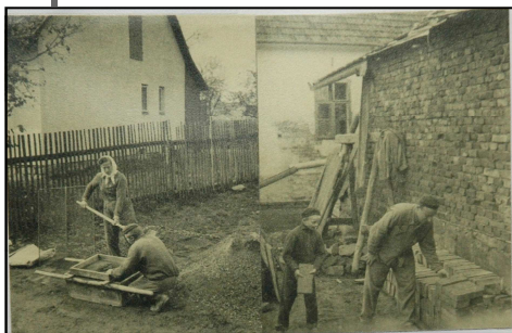
Bourání staré školy