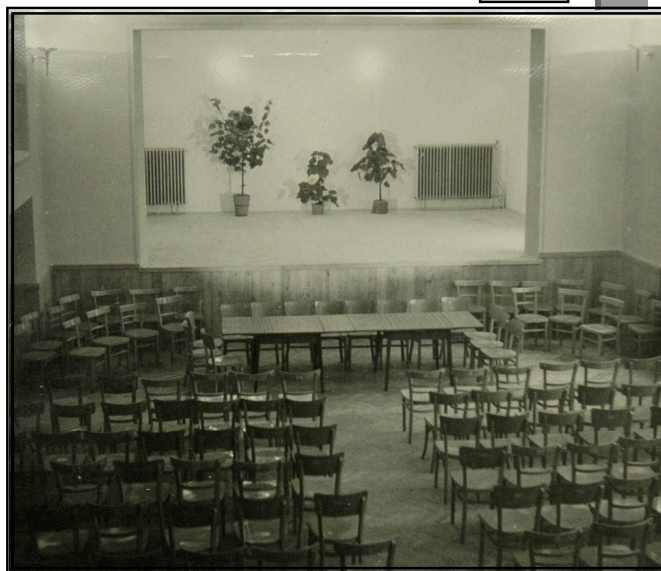
Slavnostní otevření KD v roce 1959