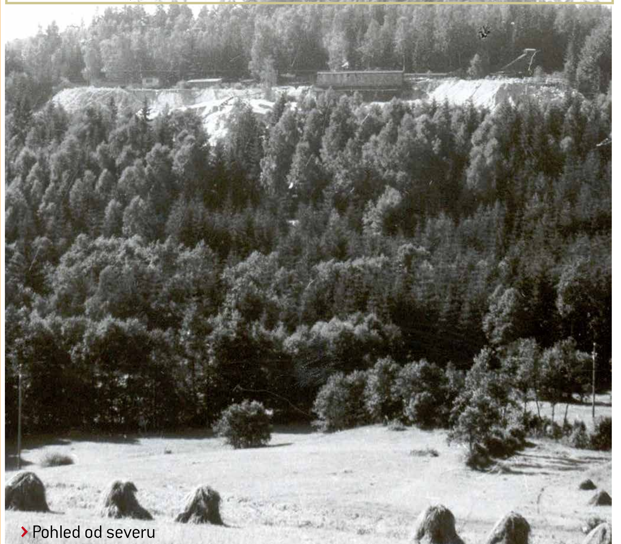
Pohled od severu

I když průzkum pro další těžbu v letech 1971-1982 zjistil zásoby pegmatitu až na dvacet let, k obnovení těžby v dole, zaměstnávajícím téměř stovku pracovníků, již nedošlo. Důvodem bylo zahájení těžby v jižních Čechách a blízkost vodárenské nádrže. Plocha po Hatích byla v osmdesátých letech lesnický rekultivována.